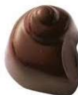
Praliné intense noir