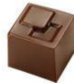
Ganache gingembre-citron noir