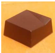
Ganache au vin noir