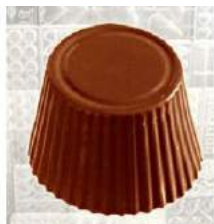
Ganache citron-Limoncello noir