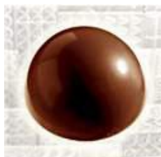
Ganache violette noir