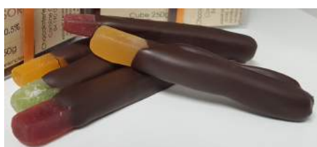
Bûchette de fruit framboise, griotte, citron vert, poire ou mangue-passion