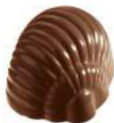
Praliné caramel craquant noir/lait/blanc