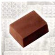
Ganache pure noir