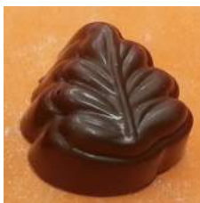
Praliné noisette noir/lait