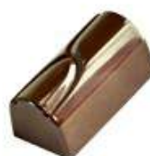
Ganache Marc de Gigondas noir