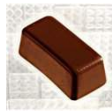
Ganache fève de Tonka noir