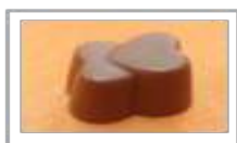
Ganache orange Grand Marnier noir/lait