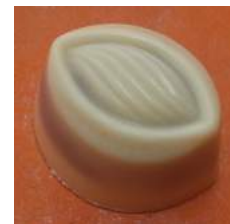
Praliné amande lait