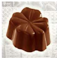
Ganache rhum-raisins noir/lait