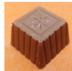
Ganache framboise noir/lait