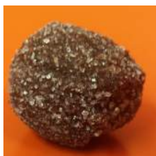
Truffes au Marc de Gigondas