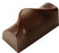
Praliné classique noir/lait/blanc