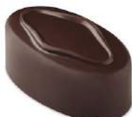
Praliné pécan noir/lait