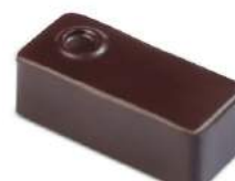
Praliné amande noir/lait