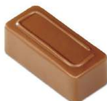
Nouveauté Praliné pistache noir