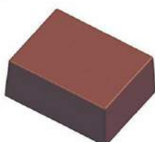
Doigt de Caroline fourré noir/lait