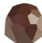
Ganache rhum raisin noir/lait