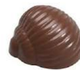
Praliné caramel craquant blanc