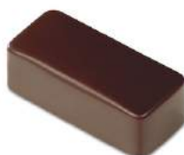
Caramel au beurre salé noir/lait