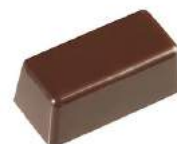
Ganache tonka noir