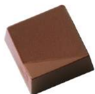
Ganache au vin Gigondas noir