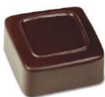
Nouveauté Ganache framboise noir