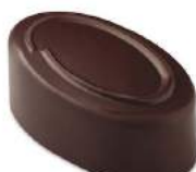
Praliné caramel craquant noir