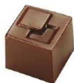
Ganache gingembre-citron noir