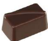
Gelée de vin rosé au sureau noir