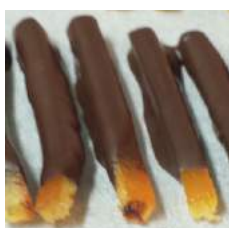
Orangette ou citronnette noir