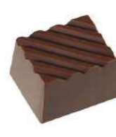
Ganache violette noir