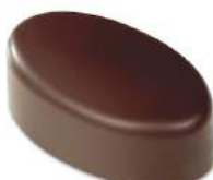
Praliné caramel craquant lait