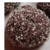
Truffe au marc de Gigondas noir