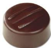
Ganache au marc de Gigondas noir