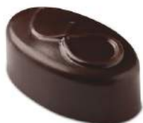
Nouveauté Praliné cacahuète lait