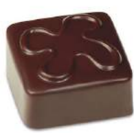
Ganache fenouil noir