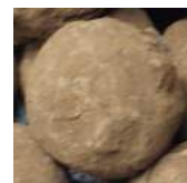
Truffe nature noir