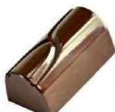
Praliné tradition noir/lait/blanc