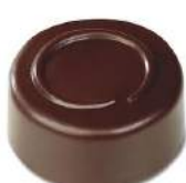
Ganache limoncello noir