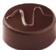
Ganache mojito noir/lait