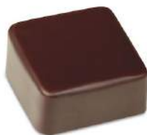
Ganache mandarine lait