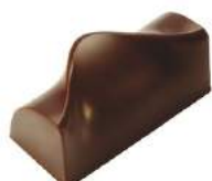
Praliné classique noir/lait/blanc