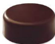
Ganache grand marnier noir/lait