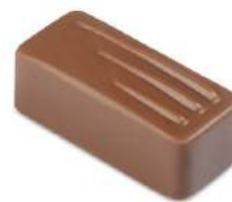
Nouveauté Caramel passion noir